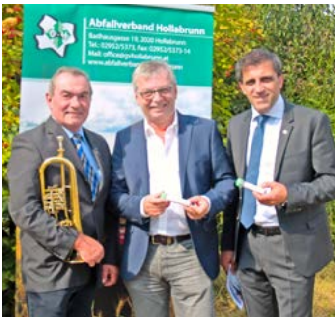
Bei verschiedenen Festen verteilen die Veranstalter unsere Taschenbecher