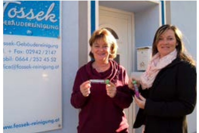
Reinigungsfirma Fosseck aus Retz verteilt an ihre Mitarbeiter die Taschenbecher

Es dauert viele Jahre, bis die Filter zerfallen. Über die Tabakreste in Zigarettenkippen wird Nikotin freigesetzt, ein toxisches Alkaloid, das die Umwelt noch mehr schädigt, als die Filter. Außerdem enthalten herkömmlich hergestellte Zigaretten Dutzende chemische Zusatzstoffe, bis zu 10 Prozent des „Tabaks“ bestehen daraus. Sie sollen die Aufnahme des Nikotins und seine Wirkung im Körper verstärken - dass sie damit auch die „Nebenwirkungen“ in der Umwelt